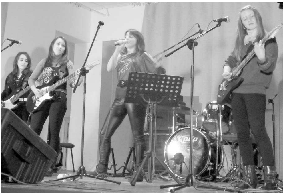
A FINELINE EGYÜTTES. NÉMILEG BŐVEBBEN A KÖVETKEZŐ SZÁMUNKBAN OLVASHATNAK A KONCERTRŐL

Félórás csúszással kezdődött a fiatalok lehetősé-